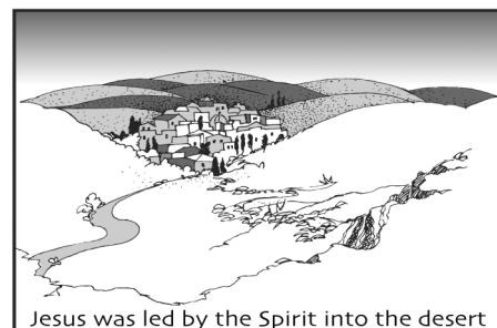
Jesus was led by the Spirit into the desert

"Come Closer to the Heart of God" Saturday, March 18, 10:00 AM to 4:00 PM, at Our Lady Of Guadalupe Church (Santa Paula). For more information please call SCRC 818/771-1361