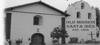
Raffle proceeds for restoration, preservation, maintenance of this Historic California Mission

Grand Prize $3,000 Second Prize $1,000 Third Prize BBO Early bird prizes